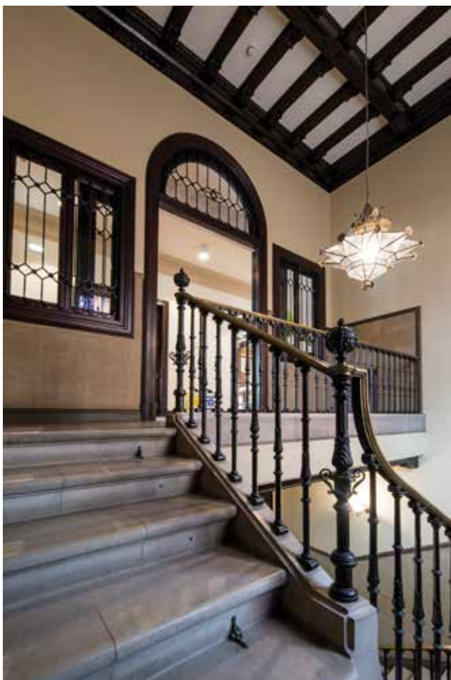
Detalle de la escalera principal. ▼

El túnel de 500 m 2 se diseñó con capacidad para 1.200 personas y disponía de cuatro accesos, de los que sólo se conserva este.