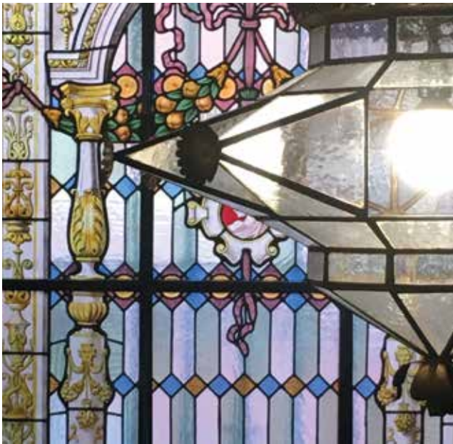
Detalle de la escalera principal. ▲

El resto de la superficie de la planta inferior, se destinaba a estancias complementarias y de servicio. A estas se accedía desde la calle de Óscar Olavarría y estaban comunicadas internamente mediante escaleras independientes.