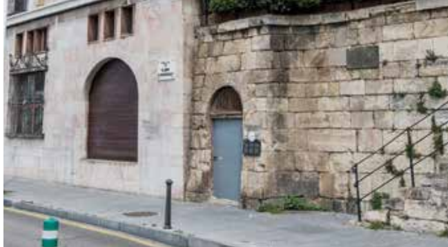
Acceso al refugio antiaéreo de Cimavilla. ▲

Al lado de la planta baja de la Casa Paquet, en la calle de Claudio Alvargonzález, se encuentra la entrada al refugio antiaéreo de Cimavilla. Es uno de los casi dos centenares de refugios que llegó a tener Gijón/Xixón entre 1936 y 1937. En ellos, la ciudadanía podía protegerse tanto de los bombardeos de la aviación franquista como del crucero Almirante Cervera y de la Legión Cóndor de la Alemania nazi.