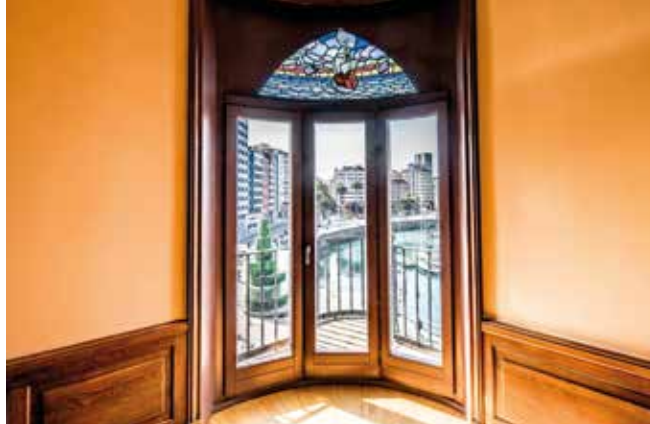
Ventanal que da acceso al balcón esquinero. ▲